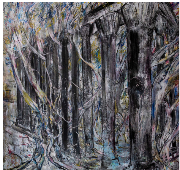
Lumière traversante II