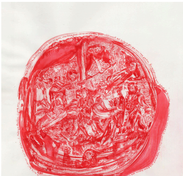
Abside Huile sur toile · 80 × 100 cm · 2024