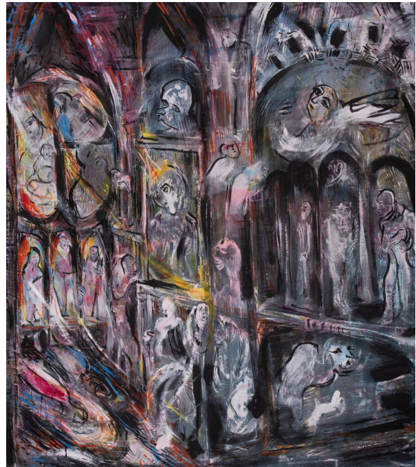
Cathédrale intérieure II