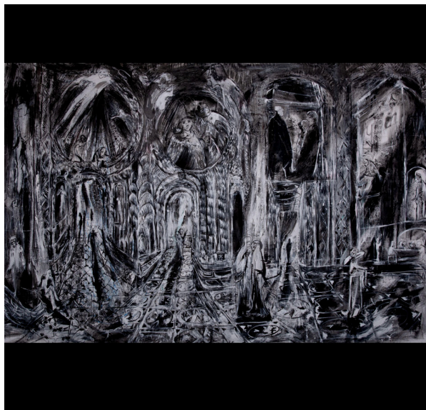
Cathédrale intérieure III