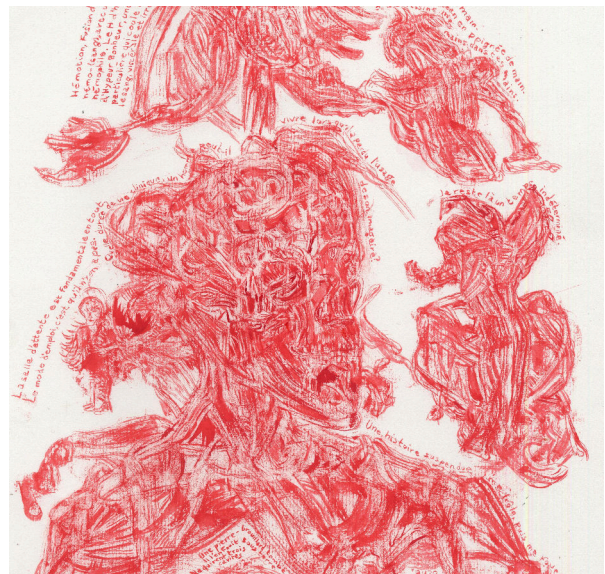
Voûte Huile sur toile · 80 × 100 cm · 2024