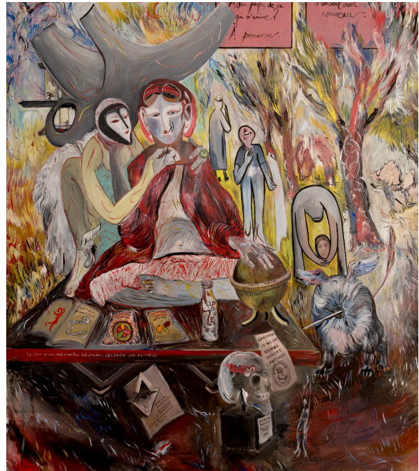
Vitrail II Huile sur toile · 100 × 120 cm · 2024