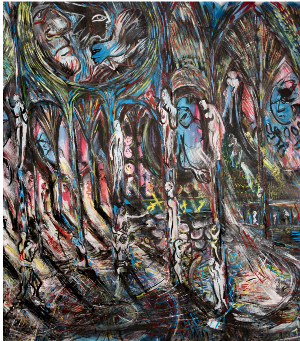
Cathédrale intérieure I