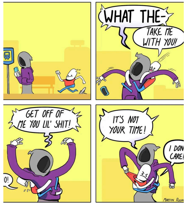
Cathédrale intérieure VI