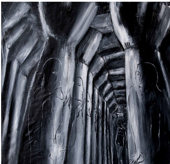
Lumière traversante I