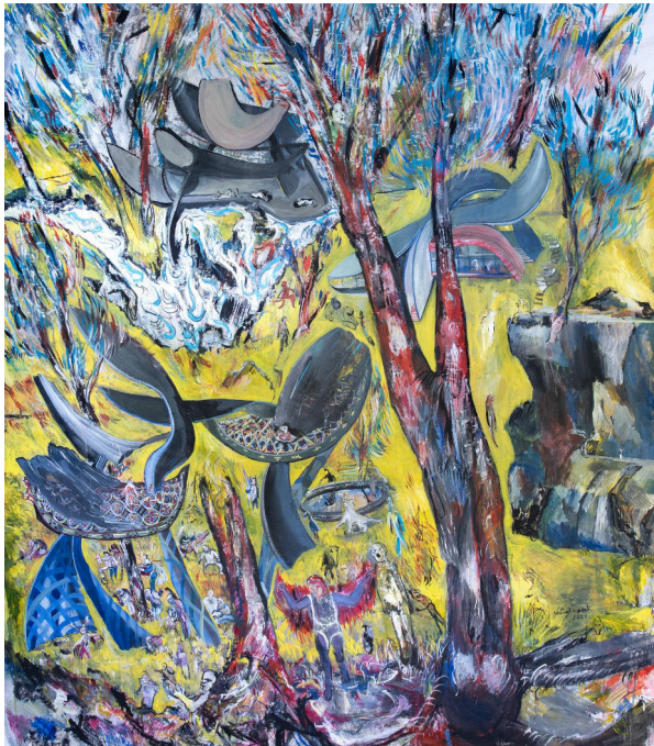
Vitrail I Huile sur toile · 100 × 120 cm · 2024